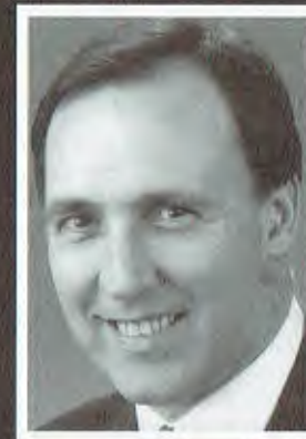
Paul Keating PM

You will receive two ballot papers: a small green ballot paper for the House of Representatives and a large white ballot paper for the Senate.